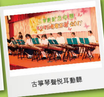
古箏琴聲悅耳動聽