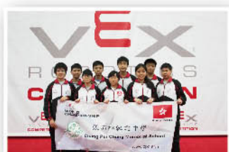
本校香港代表隊成員晉身最後八強

本校科技學會同學獲選代表香港於4月19至22日遠赴美國參加「VEX機械人世界錦標賽2017」，與來自世界各地的頂尖精英競技。是次比賽，初賽的參與隊伍超過17,000隊，分別來自全球40多個國家和地區，經過世界各地逾1,350場選拔賽才能贏得晉身總決賽的榮譽。結果，本校校隊在高中分組中成功晉身最後八強（Quarter Finalist Award），也是香港唯一獲此成績的代表隊。