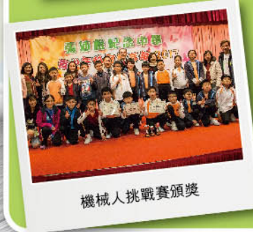
機械人挑戰賽頒獎