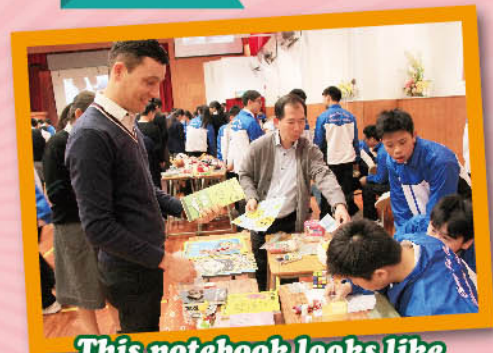
This notebook looks like a good deal!

Organized by the teachers and S2 students, the charity sale this year took place on 17th February in the school hall. Students sold items such as soft toys, books, and stationery to teachers and schoolmates. The money was donated to the Community Chest. Students got a chance to practise English through video making, asking for donations, selling and bargaining. What a meaningful event!