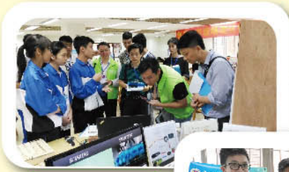
面對評判對答如流

廣東省教育技術中心主辦「首屆嶺南創客群英匯—粵港澳創客交流活動」於5月6至7日舉行，本校同學獲邀參與展示日用小件組創客作品。同學在專家問答環節對答自然，表現合拍；在協同創意環節展示創意，解說清晰，最終獲得創客項目現場測試的「最佳團隊獎」。