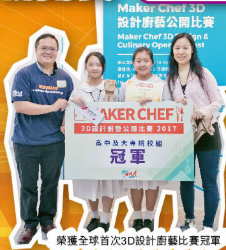
榮獲全球首次3D設計廚藝比賽冠軍

本校成立 STEM Maker Base「創客基地」的目的是期望透過一系列精心設計的創意工作坊，以及日常教學活動，讓參加者能享受親手製作(DIY)的過程，並將 STEM (科學 S cience、科技 T echnology、工程 E ngineering及數學 M athematics)的概念，融入日常生活之中，以更好地培養創新精神。