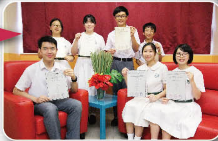
晉級賽奪得3個銀獎和4個銅獎，並獲邀加入香港代表隊

本校8位同學參加「亞洲國際數學奧林匹克公開賽」，先在初賽全部獲得獎項，再在近九千名香港數學精英參加的晉級賽中，獲得3個銀獎和4個銅獎，並獲邀加入香港代表隊，於8月3日遠赴馬來西亞的University of Malaya參加亞洲總決賽。