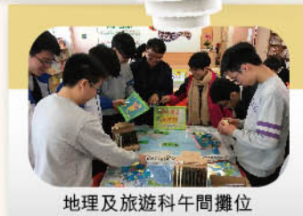
地理及旅遊科午間攤位