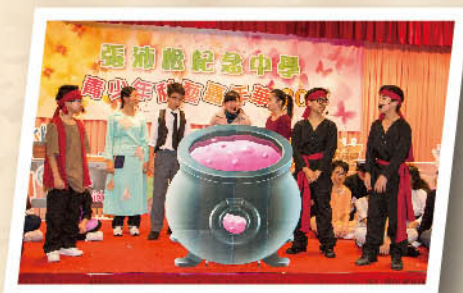
Have you ever seen such a big pot of soup?