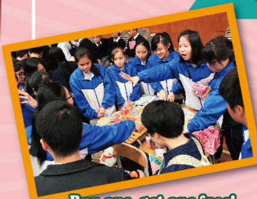
Buy one, get one free!