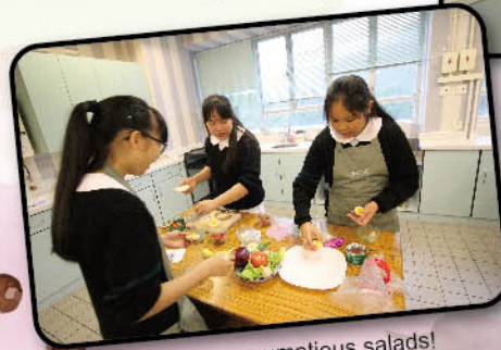
Let's make scrumptious salads!