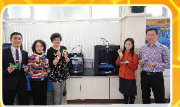
老師試用鐳射切割機