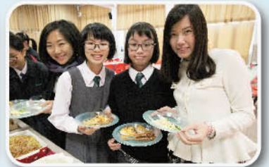
師生愉快地享用午餐