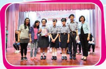
紅十字青年團奪得最受歡迎團隊導師獎

結業禮由校長及兩位副校長主禮，經過他們檢閱五個團隊後，隨即頒發最優秀隊員獎及服務金獎(服務5年)、銀獎(服務4年)、銅獎(服務3年)。為配合本年度關注項目，今年增設「六藝展才華—技能交流」獎項，讓團隊領袖展示所屬團隊的專長，例如道路語言、手語、繩結、急救及款待等，最後由聖約翰救傷隊獲得最受歡迎團隊課程獎，以及紅十字青年團獲得最受歡迎團隊導師獎。