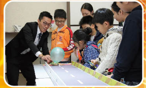
成功製作氣球動力車