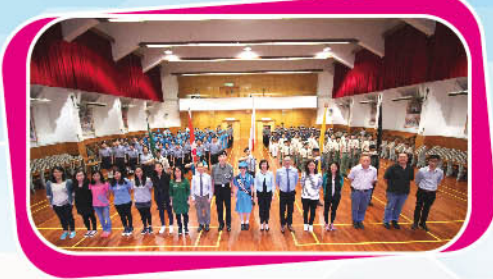
校長、副校長、老師與全體團隊成員大合照