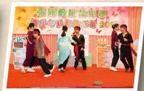
The gypsies and the orphans are dancing happily.