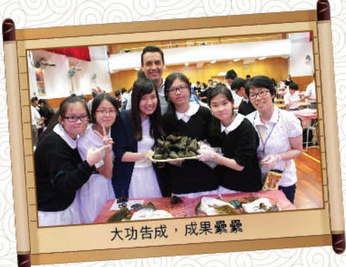
大功告成，成果纍纍