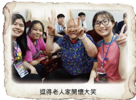
逗得老人家開懷大笑