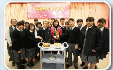
初中全級首五名同學與校長一起慶祝