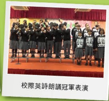
校際英詩朗誦冠軍表演