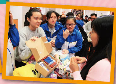
A tempting bargain!