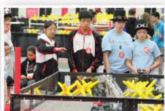
全神貫注操控機械人