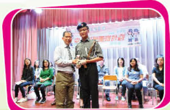
副校長頒發服務獎