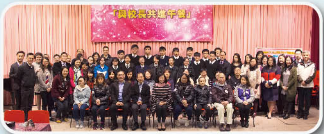
高中各科第一名同學與校長、家長、老師拍照留念