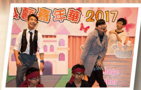
Look at their cheerful smiles!