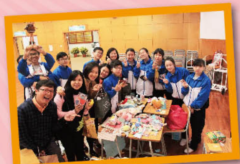
We are ready to make good sales!

Organized by the teachers and S2 students, the charity sale this year took place on 17th February in the school hall. Students sold items such as soft toys, books, and stationery to teachers and schoolmates. The money was donated to the Community Chest. Students got a chance to practise English through video making, asking for donations, selling and bargaining. What a meaningful event!