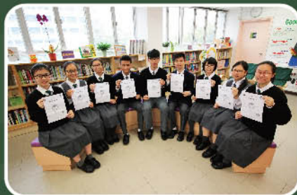
現場作文香港區初賽和決賽