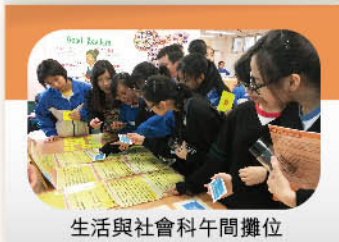
生活與社會科午間攤位