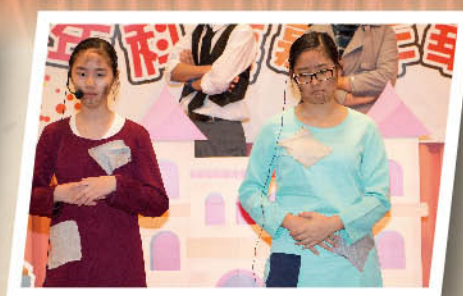
Poor dirty orphans are starving and looking for food.