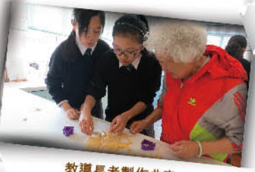
教導長者製作曲奇

德育及公民教育組與基督教宣道會白普理景林長者鄰舍中心合辦「眼中的你-跨代共融紀念冊」系列活動。同學除教授長者使用智能電話及常用手機程式，還教導長者製作曲奇，長幼共融。最後一節，同學為長者送上「跨代共融紀念冊」，並由長者教導同學製作中國傳統湯圓，倡導兩代彼此欣賞文化。