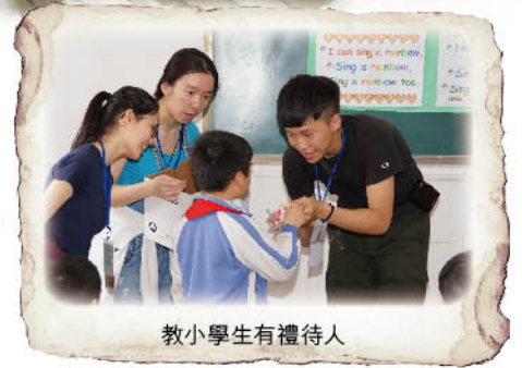
教小學生有禮待人