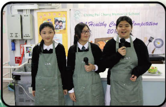
Students speak confidently in their presentations.