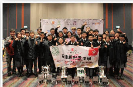
高中組和初中組均榮獲卓越獎

本校科技學會於2月11日在香港工程挑戰賽2016有卓越表現，高中組和初中組均獲得卓越獎，並奪得出戰世界錦標賽的資格。