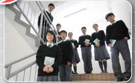
初賽獲2個銀獎和6個銅獎