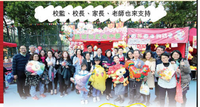
校監、校長、家長、老師也來支持

為讓同學親身體驗營商之道，擴闊學習視野和經歷，本校同學於1月23至27日在寶康公園舉辦了第四次的年宵攤位活動。同學表現非常出色，推銷積極，待客有禮，態度友善，給顧客留下良好印象，是次活動，在扣除成本後，同學將一半利潤捐贈予「香港公益金」作慈善用途。最後，再次感謝曾經光顧本校年宵的各位坊眾、家長、老師和學生，讓同學有寶貴的營銷體驗。