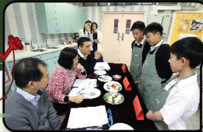
Students explain the nutritional value of their ingredients.