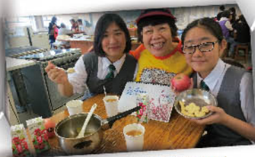
送上「跨代共融紀念冊」