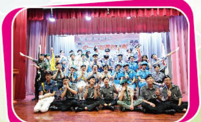
大家都樂於成為團隊領袖