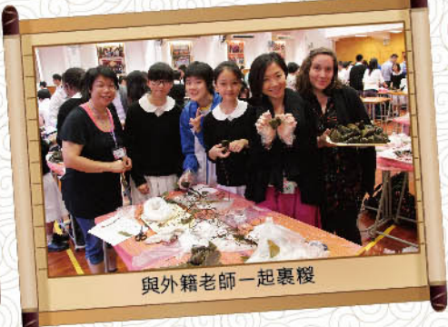
與外籍老師一起裹糴