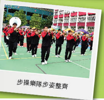
步操樂隊步姿整齊