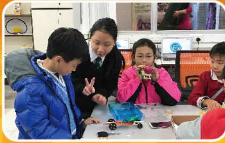
指導小學生製作氣球動力車