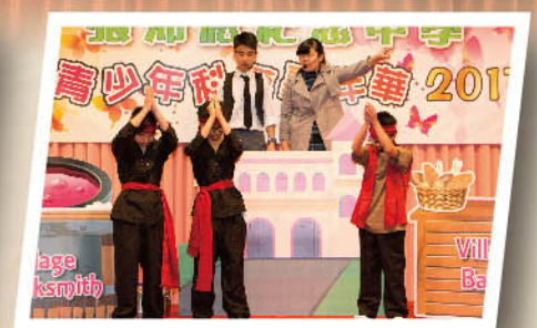
The helpless gypsies are seeking help from the Misers.