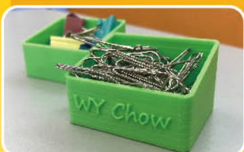
個人特色的文具盒子