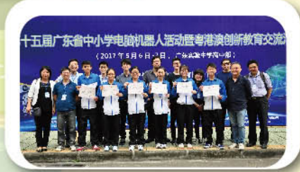
獲得創客項目「最佳團隊獎」