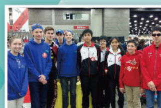
與世界各地精英交流