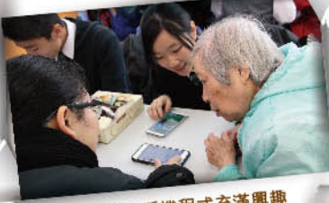
長者對常用手機程式充滿興趣