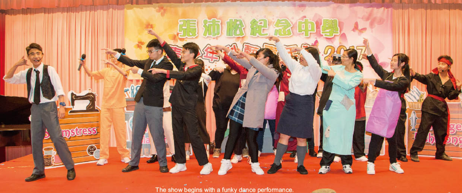
The show begins with a funky dance performance.

Our CPC Drama Team members performed an ensemble drama piece entitled 'Stone Soup' in the 2016-2017 Science and Arts Carnival on 26th March in the lecture hall. Our tale begins in a busy village with busy villagers when hungry gypsies convince them to share a small amount of their food. Our drama team came together to engage our delighted local audience, and through their teamwork and exceptional performance taught us the importance of sharing.