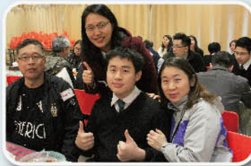
家長、師生歡聚一堂

校長邀請考獲初中全級首五名、高中各科第一名同學分別於3月8及9日出席「與校長共進午餐」活動，同學們可邀請一位老師及家長一同參與。校長讚賞同學勤奮學習，爭取理想佳績，並勉勵同學繼續努力，成績更上一層樓。