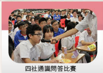
四社通識問答比賽