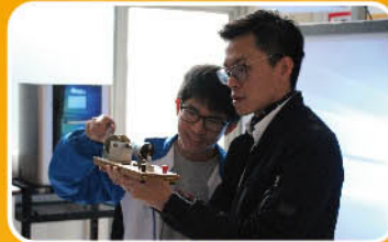
討論電路如何接駁