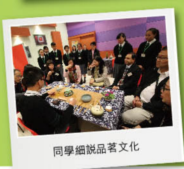
同學細說品茗文化