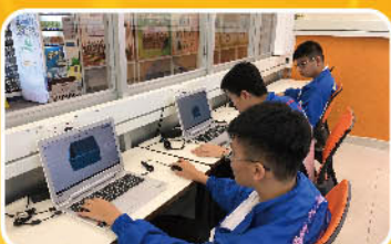
電腦繪圖設計文具盒子