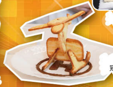
3D設計廚藝比賽 冠軍作品－「信心機」