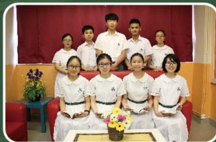
現場作文全國總決賽