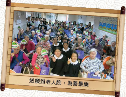
送糴到老人院，為善最樂