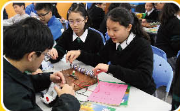
親手接駁完整電路