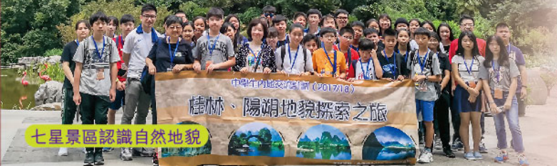
七星景區認識自然地貌