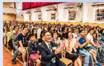
全場觀眾笑逐顏開，氣氛熱鬧