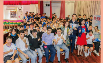
讀書會同學獲益良多