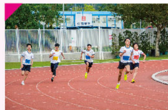
各社健兒一展身手，爭取佳績