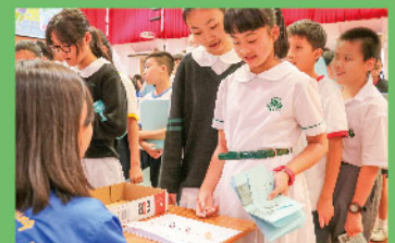
「骰仔練心術」提升運算速度