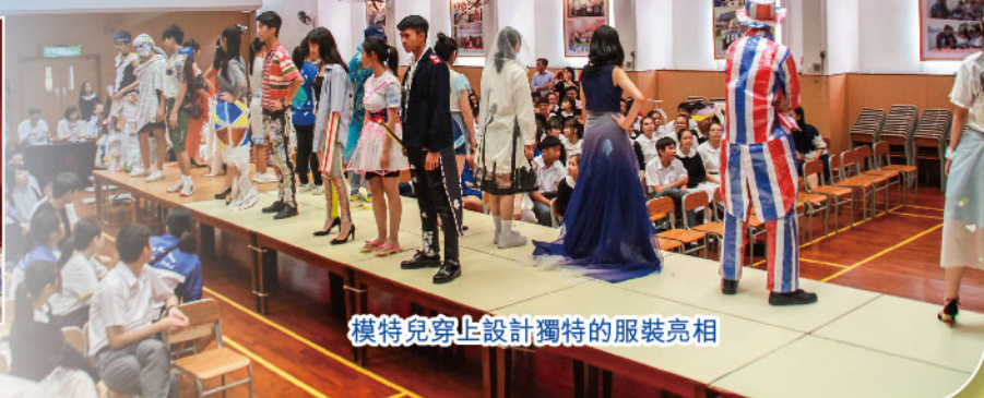
模特兒穿上設計獨特的服裝亮相