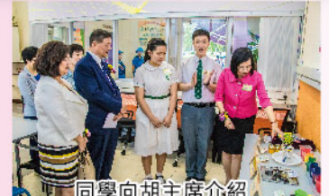
同學向胡主席介紹 STEM Maker Base的展品