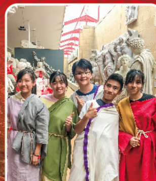
穿上古希臘服裝，體驗異國風情