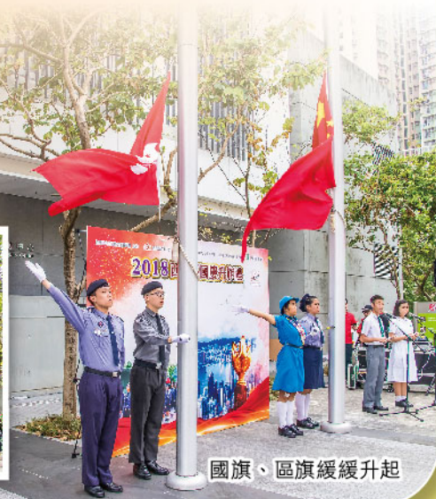
國旗、區旗緩緩升起