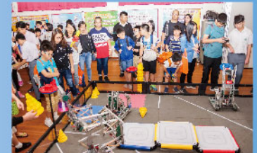
來賓對機械人示範甚感興趣