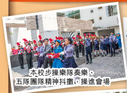
本校步操樂隊奏樂、五隊團隊精神抖擻，操進會場

9月28日由西貢區公民教育促進委員會主辦的「2018西貢區國慶升旗禮」假西貢將軍澳政府綜合大樓前地舉行，本校同學負責司儀介紹、制服團隊擔任升旗隊、步操樂隊現場奏樂。升旗儀式莊嚴隆重，步操樂隊演奏《歌唱祖國》，升旗隊昂首闊步進入會場，整齊肅立，國旗、區旗伴隨國歌，緩緩升起，隨風飄揚。觀禮嘉賓稱讚同學表現優秀，充份表現出團隊精神。