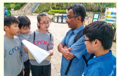
We were busy bees, trying to complete our mission. Keep it up, buddies!