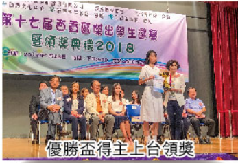
優勝盃得主上台領獎