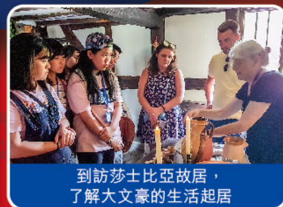
到訪莎士比亞故居，了解大文豪的生活起居