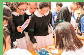
「旋轉360」加強幾何思考能力