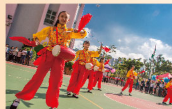
鳳陽花鼓節奏活潑明快