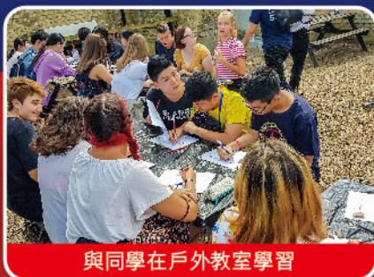
與同學在戶外教室學習