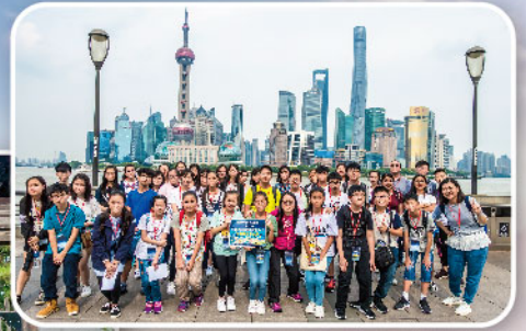
觀摩多國建築風格雲集的「東方華爾街」