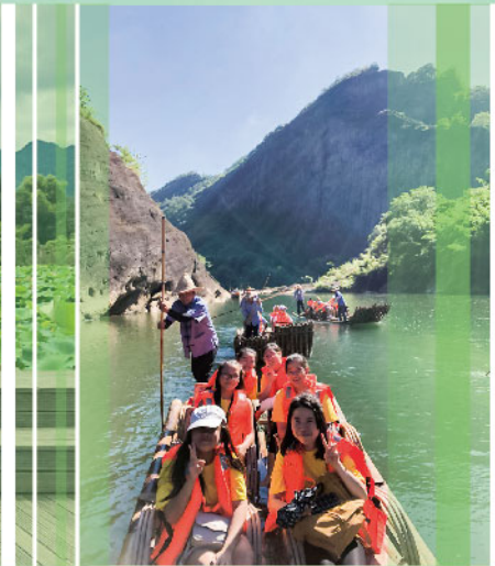
九曲溪而下，尋幽探勝