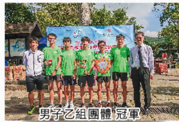
男子乙組團體冠軍

越野隊經過多月的積極備戰，刻苦鍛煉，過程中隊員互相勉勵，展現團隊合作精神，在比賽中奪得男子乙組團體冠軍、女子甲組團體冠軍、男子團體總殿軍及三項個人獎項。