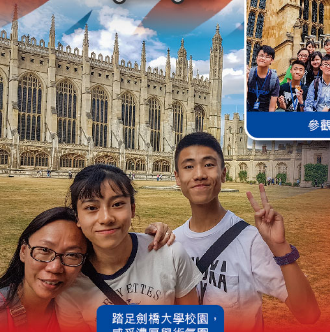
踏足劍橋大學校園，感受濃厚學術氛圍