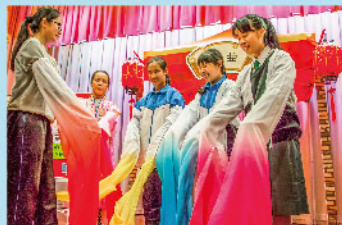
體驗戲曲水袖功技巧