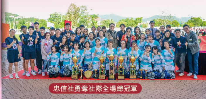
忠信社勇奪社際全場總冠軍

田徑運動會於12月10至11日假西貢鄧肇堅運動場舉行。當日邀得香港警務處將軍澳警區警民關係組警民關係主任卓月精總督察擔任主禮嘉賓，為大會致詞及頒獎。當日，各社健兒全力以赴，力爭佳績；啦啦隊奮力為健兒吶喊助威，呼聲不絕；老師家長踴躍參與，全校上下一心。