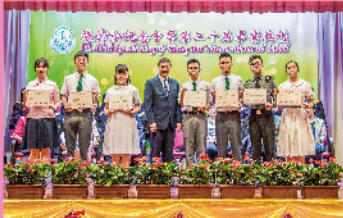
胡主席頒獎給獲獎同學