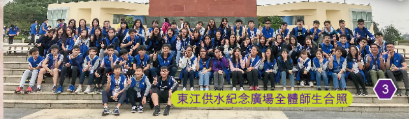
東江供水紀念廣場全體師生合照