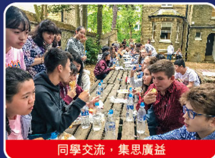
同學交流，集思廣益