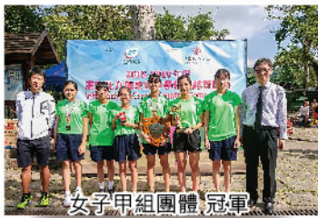
女子甲組團體冠軍