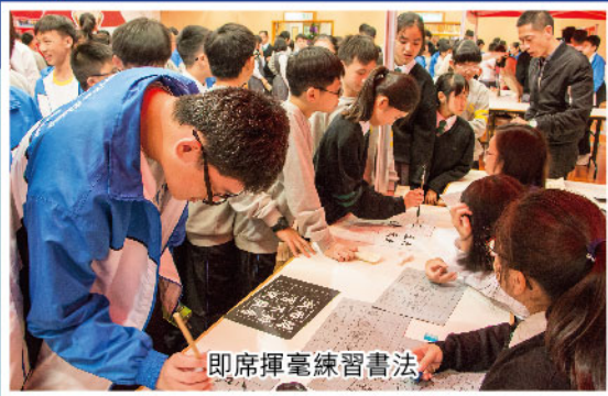
即席揮毫練習書法

中文科於11月26日至29日舉辦「趣」「脆」中文週之「沛松藝廊」，內容圍繞中國傳統藝術。同學研讀專題文章，認識中國傳統藝術的歷史與演變、文化精神與特色。同學亦到「沛松藝廊」親身體驗皮影戲、音樂、書法、戲曲、摺紙、繪畫的樂趣。活動新穎有趣，同學全情投入，寓學習於娛樂。最後一天換取「冰淇淋脆烤卷」作獎勵，其樂融融。