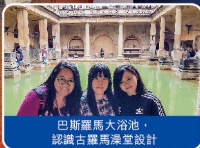
巴斯羅馬大浴池，認識古羅馬澡堂設計