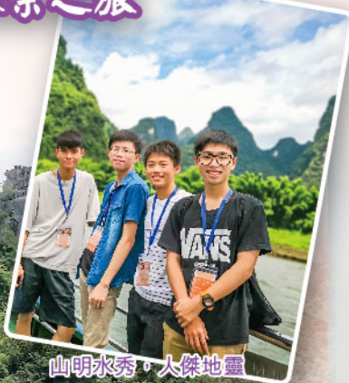
山明水秀，大傑地靈

6月25-27日同學到桂林和陽朔考察其地貌形成、發展與保育。他們到中國岩溶地質館參觀，又飽覽灑江、象鼻山、七星景區、銀子岩等美景。這趟旅程讓同學認識自然地貌形成的原因，體會到平衡旅遊業與環境保育的重要性。