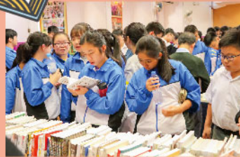
同學紛紛選購心儀書籍