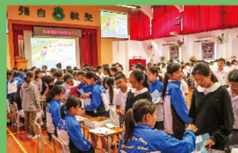
同學踴躍參與活動，禮堂人山人海