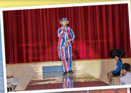
同學善用物料，循環再造，手工精美

由領袖生籌辦的「環保時裝設計大賽2018」，參賽同學以不同的環保物料拼湊及搭配，用心設計服飾，宣揚環境保育的信息，別出心裁。當天模特兒穿上設計獨特的服裝，有些高貴優雅，有些造型新穎，有些時尚型格，姿態萬千，甚具風範。評判十分欣賞同學的表現，這是一次難忘的體驗。