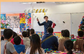
Creative DIY Xmas Cards工作坊