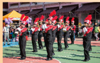
步操樂隊演奏，氣勢磅礴