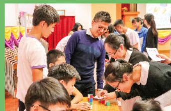
「四色盒子」考驗同學腦筋