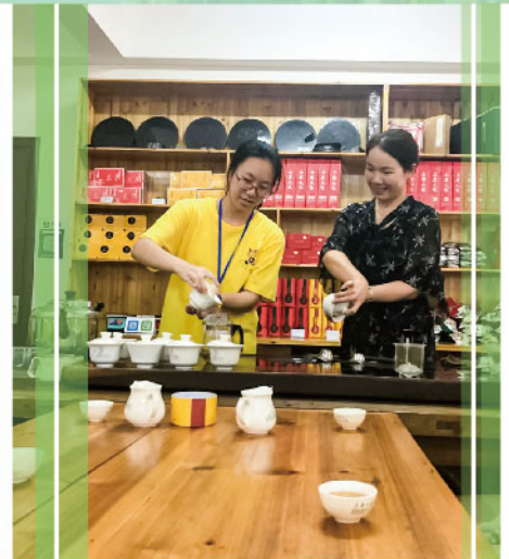
跟茶藝師學習泡茶功夫