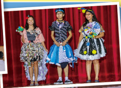
同學創意十足，把環保主題融入時裝設計