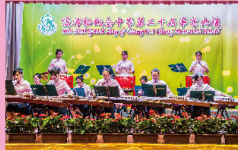
古箏小組演奏，動人心弦