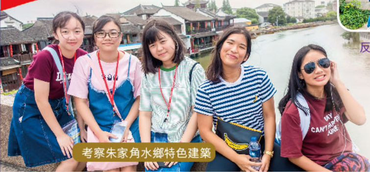
考察朱家角水鄉特色建築