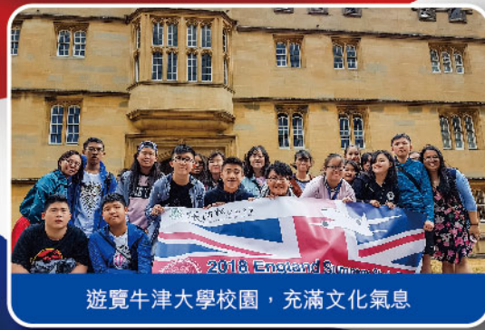
遊覽牛津大學校園，充滿文化氣息