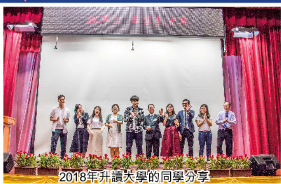
2018年升讀大學的同學分享 與恩師的校園點滴