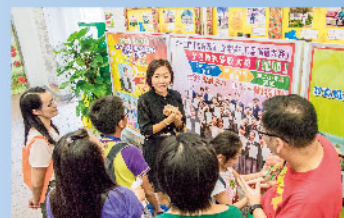
校園導賞了解學校特色