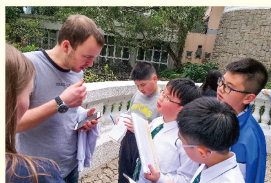
The tourist was nice and helpful!