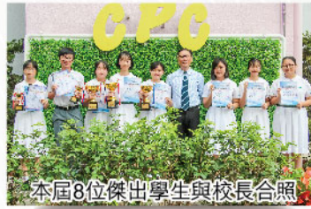
本屆8位傑出學生與校長合照

「第十七屆西貢區傑出學生選舉」由西貢文化中心社區發展基金會有限公司主辦，嘉許學業及體藝成績卓越、熱衷服務社群、關心社會及國家大事之傑出表現學生。本校三位同學榮獲「優勝盃」最高殊榮，三位獲「嘉許狀」，兩位獲才藝文化傑出學生獎，成績令人鼓舞。