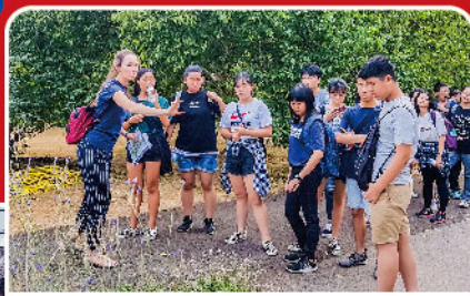
劍橋大學植物園教育工作坊