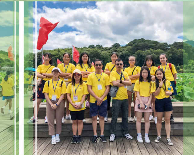
暢遊中國十大美村之一的培田村

7月17-23日同學到福建展開尋根之旅，參觀永定土樓文化民俗村、閩西革命歷史博物館、文化名村「培田村」、林則徐故居、南少林寺和廈門大學等，又到武夷山茶博園學習泡茶、乘竹筏沿九曲溪漂流而下。旅程中，同學認識客家建築文化，欣賞福建山河之美，從泡茶品味人生浮沉與淡雅。