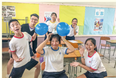
We are the best team!