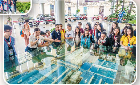
認識上海大眾汽車廠房的自動化