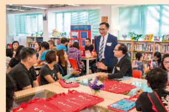
升中資訊分享，來賓反應熱烈

「升中資訊日暨開放日2018」於12月2日下午舉行，讓坊眾了解學校最新的發展。當天活動包羅萬有，有升中資訊分享、英語工作坊、古箏表演、步操樂隊表演、鳳陽花鼓、學科攤位遊戲、沙畫、趣味扭波波、茶藝、機械人、參觀水耕法溫室、航拍等。來賓非常欣賞本校的活動安排，讚賞活動多元化、表演精彩吸引、同學彬彬有禮，校園洋溢著輕鬆愉快的氣氛。