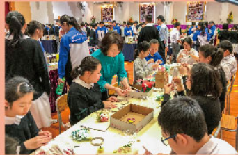
老師教授DIY簽名筆製作