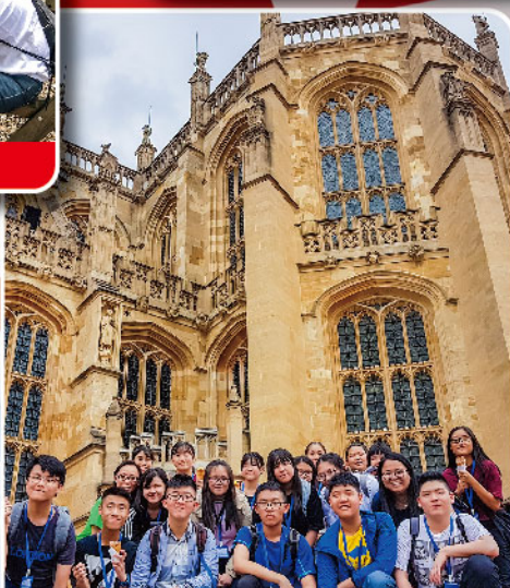
參觀歷史悠久的溫莎堡