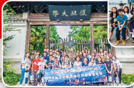
反思大學校訓「日復一日」的學習精神

6月26-29日同學到上海遊覽陸家嘴金融貿易區和上海外灘，到訪上海工商銀行和上海大眾汽車有限公司廠房，考察朱家角水鄉，也到復旦大學上課，藉此認識上海經濟金融業及自貿區的最新發展，探討現今上海的城市規劃及反思城市發展與環境保育的平衡。