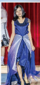
模特兒穿上環保設計的晚裝，盡顯美態