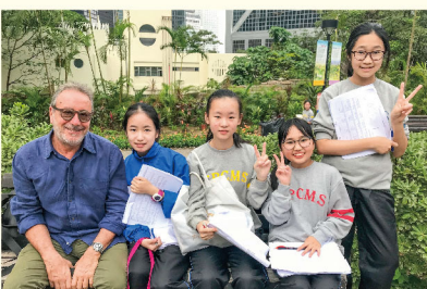
Thank you for doing the interview and we hope you enjoy your stay in Hong Kong!

On 5th December, a mission was arranged for our S.1 students. They got the chance to interview foreigners about their visit to Hong Kong in order to practise their oral English outside the classroom. They conducted the interviews in small groups. After the interview, students used the information they collected and made a report to consolidate what they had learnt. With such exposure to an authentic English environment, students' language skills as well as their interest and confidence in English can be enhanced.