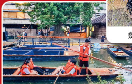
撐船遊康河，感受徐志摩詩中的美景