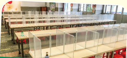
飯堂設有間隔板保障同學健康