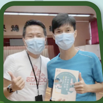
黎老師獲教育局邀請與同工分享校本經驗