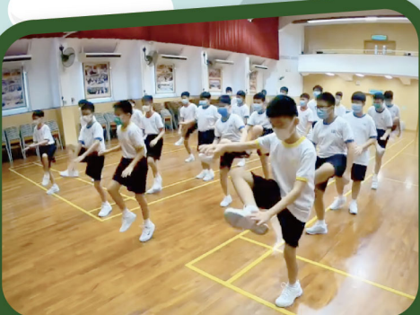
足毽課增強身體的協調性、靈活性和平衡能力

由於疫情關係，同學上體育課時需要佩戴口罩及保持社交距離，因此老師特意設計了較個人的體育活動，包括足毽及瑜伽。同學能保持合適的運動量，又能舒展身心。本校亦獲邀參與教育局舉行的「發展活躍及健康的中學校園」計劃，教育局體育組到校拍攝體育課堂，並將本校足毽及瑜伽課堂製作成教學影片，分享予各中、小學體育科老師。