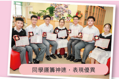
同學運籌神速，表現優異

同學在總決賽獲得佳績，可喜可賀。大灣區秉承數學競賽精神，且給予參賽同學了解大灣區發展的機會，促進兩地與國際交流。