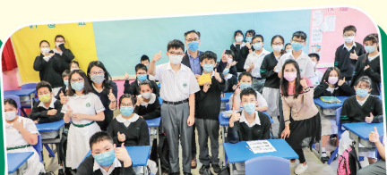
學行獎勵計劃表揚實時網上學習表現積極的同學，鼓勵自主學習