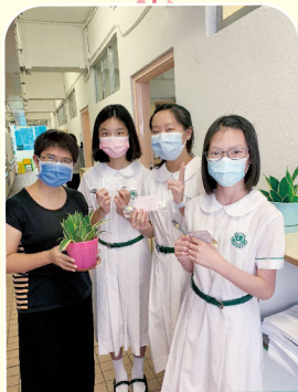
導師計劃在恢復面授課後，各導師向中一同學送上鼓勵