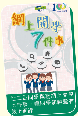
社工為同學撰寫網上開學七件事，讓同學能輕鬆有效上網課