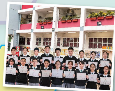
初賽榮獲18個獎項，晉身選拔賽