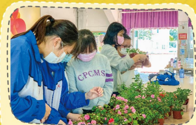
同學悉心整理盆栽， 助人的種子悄然在心中發芽。