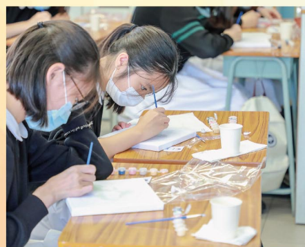
藝術文化多面睇， 感受藝術樂趣。