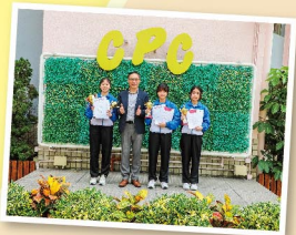
三人舞展現默契，榮獲多個獎項。