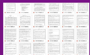
網上早讀文章讓同學積學儲寶