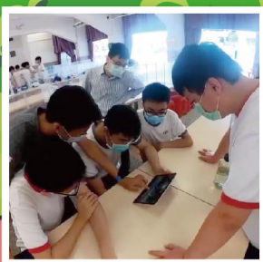
檢視動作，老師從旁指導。

本校體育課程持續加入電子學習元素，今年4月再次獲教育局體育組邀請，到校拍攝體育課堂，並將課堂製作成教學影片，訪問過程亦刊登於雜誌《運動版圖》，與各界分享。課堂示範「新式」接力課，運用電子器材拍攝老師的示範動作及教學重點，於課後讓同學重溫，鞏固學習。另外，亦會拍攝同學的動作，透過平板電腦的慢動作重播功能，可以觀察自己和同儕需要改善的地方，通過思考，作出改進，進一步提升學習效能。