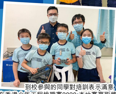
到校參與的同學對培訓表示滿意，展示成果，並在香港少年工程挑戰賽2020-本地賽贏取獎項(卓越獎、優異獎等)。