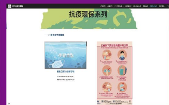
「德育互動站」提供抗疫環保資訊， 令同學建立良好的公共衛生意識。