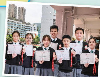
決賽獲得代表香港的資格