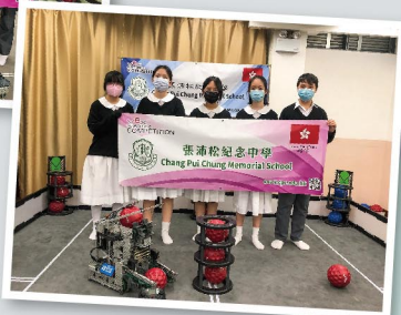
科技學會同學代表香港，以網上形式參與在美國舉行的比賽。