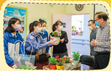
公益少年團慈善花卉義賣 為公益金籌款