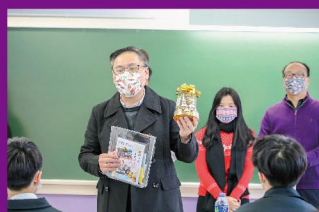
校長為中六同學打氣