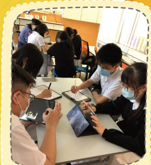
V Ai Prefect培訓工作坊