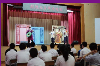
戲說文言巡迴表演， 提升學習文言文興趣。