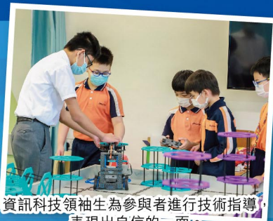
資訊科技領袖生為參與者進行技術指導，表現出自信的一面。