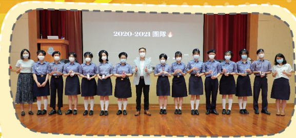
團隊計劃表揚團隊隊長的貢獻

疫情期間，部分活動在可行的情況下，改以網上直播形式授課。步操樂隊及古箏小組在老師的指導下，除繼續恆常練習外，亦學習新曲及提升演奏技巧；籃球校隊在網上課程，先學習理論及在家練習簡單動作，為日後訓練打好基礎。疫情稍緩，本校根據教育局指引，恢復部分活動於下午或星期六進行，同學都全情投入，樂在其中。今年同學體驗了不一樣的課外活動體驗，留下深刻的印象。