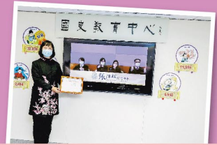
評判欣賞本校的推廣策略，加深同學對主題的認識。

人物選舉以「科教興國，經世濟民」為主題，本校以跨科協作的形式推廣活動。評判欣賞全校參與模式，同學透過閱讀文章、觀看短片、參加專題書展和早會分享等，不但了解歷史人物的生平與科研貢獻，也學懂欣賞古人在條件有限的社會中，作出很多科研嘗試，貢獻後世。