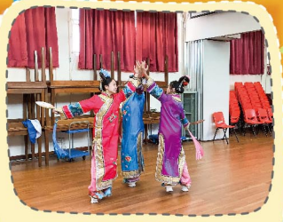
中國舞優美典雅，同學不斷鑽研提高水平。