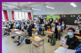
應試錦囊為同學 增加信心、穩中求勝。