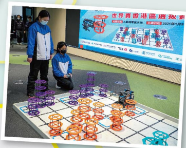
因應比賽的場景，調整機械人。