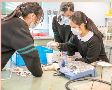
同學專心進行科學實驗

老師為各級同學準備多元化的活動，讓同學從探究中學習，拓闊視野。同學藉著科學實驗、話劇欣賞等不同體驗，驗證且活用所學，並裝備書本以外的知識和技術，體味多動腦筋、多思考的好處，發展興趣潛能，為升學就業做好準備。