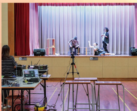
觀賞話劇團表演， 箇中道理相勸勉。