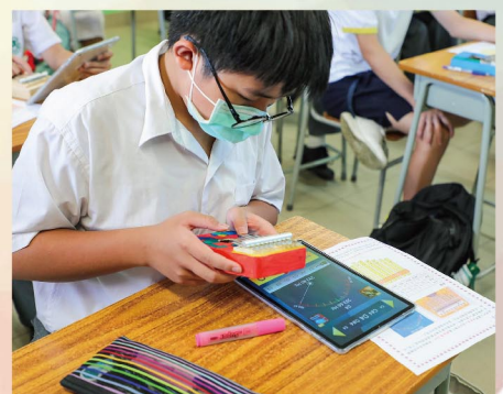
自製彩繪拇指琴， 以平板電腦調音。