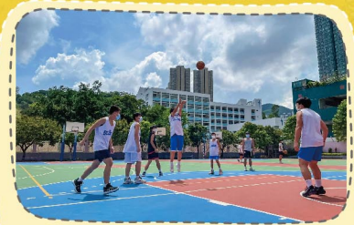
校隊訓練增強體魄