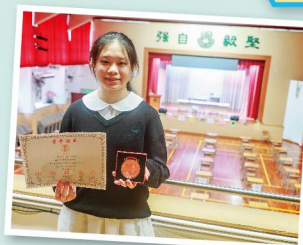
總決賽贏得三等獎