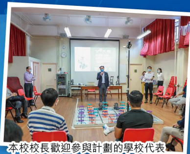
本校校長歡迎參與計劃的學校代表