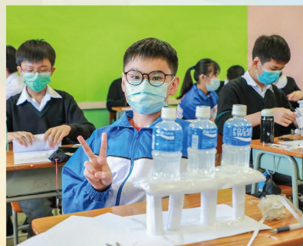
動手製作橋樑模型， 創意解難從容淡定。