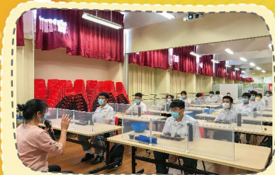
茶藝老師講解茶的歷史和文化