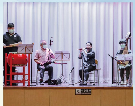
中樂的金石絲竹， 清亮而沁人心肺。