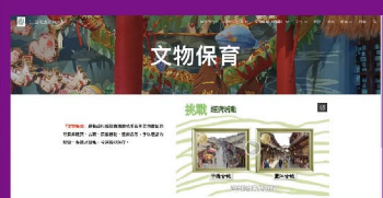
「江山如此多fun」網站 令同學擴闊眼界

為配合新常態的學習模式，學術推廣組於網上設立「早讀文章」庫，內有不同學科的知識和資訊，讓同學增廣見聞、拓闊見識；並邀請畢業生回校分享讀書心得及應試技巧，值得同學參考及借鏡。德育、公民及國民教育組設立「江山如此多fun」和「德育互動站」網站，以抗疫、環保及各學科範疇為主題，不斷更新資訊，幫助同學將不同的知識融會貫通，活學活用。此外，該組更與輔導組和社工為應屆考生準備應試錦囊，為他們打打氣。學行獎勵計劃派發中證書，表揚表現優秀的同學。希望同學能夠才德兼備，在新的學習模式下仍能不停進步。