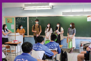
畢業生回校與師弟妹 分享讀書心得及應試技巧