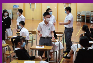
戲說文言以「視覺化理解」的 活動方式教導同學《逍遙遊》