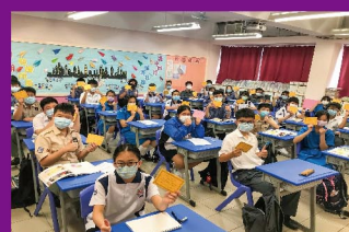
學行獎勵計劃， 表揚同學勤奮向學、熱心服務。