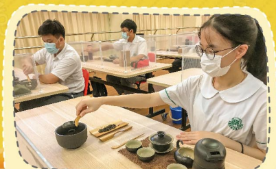
茶藝小組練習泡茶