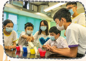
科學實驗探究毛細管作用