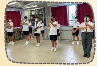
步操樂隊步操，合拍整齊。