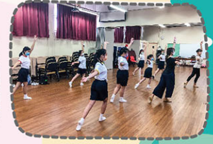
舞蹈組展現優美舞姿