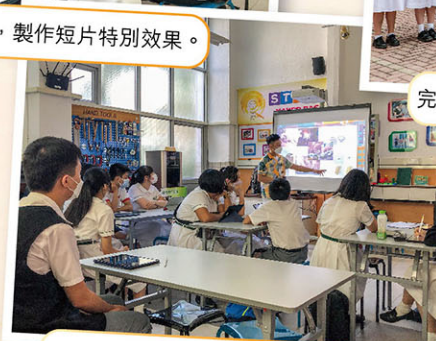
學習電腦繪圖、排版等技巧。