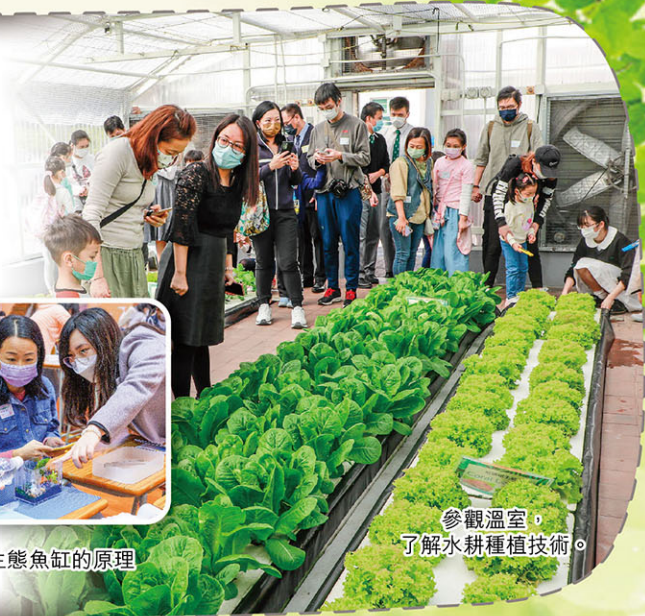
參觀溫室，了解水耕種植技術。