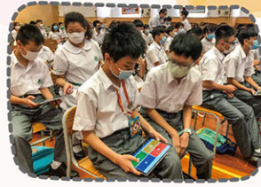
解疑問難，互相幫助。