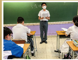
同學即席演講，活學活用。