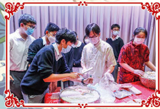
同學將盆中的糖塊鑿碎