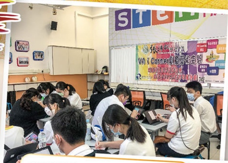
影片實驗室，製作短片特別效果。

計劃配合STEM教育的發展，讓同學增添多媒體創作體驗和能力。視覺藝術科舉辦一系列的藝術培訓工作坊，如：製作虛擬故事書、藝術漫步、設計實驗室、影片技巧，提升同學運用資訊科技進行藝術創作的的能力。