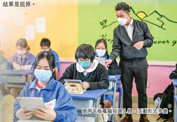
使用平板電腦投選人物，活動形式多變。