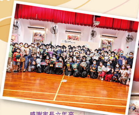
感謝家長六年來與師生並肩同行