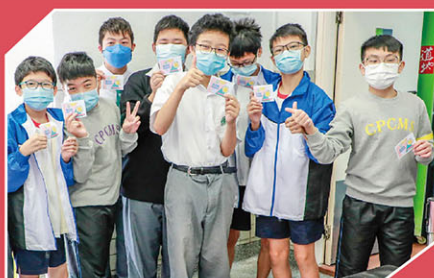
同學拿著小食部現金券，雀躍萬分。