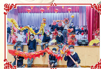
舞龍舞獅為傳統節日添喜慶