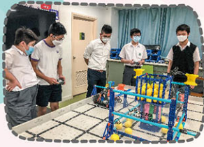
同學對機器人操作甚感興趣