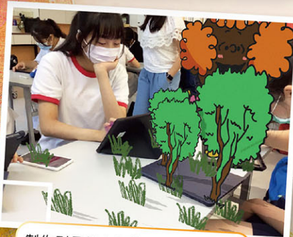
製作別具個人風格的虛擬故事書。