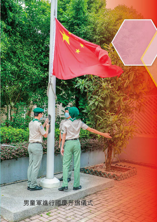
男童軍進行國慶升旗儀式

本校於9月28日舉行國慶升旗禮，慶祝中華人民共和國成立72周年。五隊制服團隊負責升旗儀式，開始時同學面向旗桿、肅立，國歌奏起，仰視國旗冉冉升起。同時，各級課室直播整個過程，全校師生態度認真專注，同學舉止莊重。兩位領袖生在升國旗儀式後，進行國旗下的講話，祝願國家繼續繁榮發展。