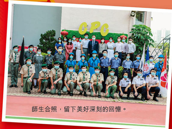
師生合照，留下美好深刻的回憶。