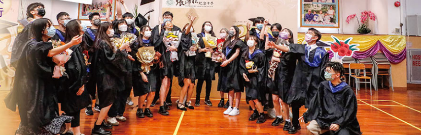
齊拋畢業帽，寓意人生勇闖高峰。