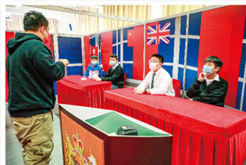
同學認真思考，破解密碼鎖。

德育、公民及國民教育組、生社科、公民科、通識科及家教會聯合舉辦「基本法推廣週」，透過嶄新的活動認識基本法，包括：密室解迷、基本法歷史走廊、拼圖大挑戰、看圖猜猜。活動富有挑戰，從互動遊戲中學習，家長、老師和同學一起闖關。