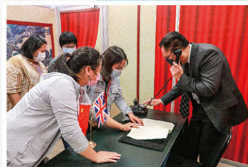
校長帶領家長參與「時空解迷」遊戲