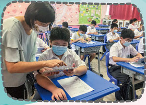
銜接班同學積極學習

在8月下旬一連五日的中一迎新週，中一新生初次接觸本校的各樣活動，體驗中學生活。迎新週內容多采多姿，有學科升中銜接班、導師計劃簡介、團隊計劃介紹、網上學習工作坊及十多項課外活動體驗。活動有趣且多元化，同學在愉快的環境中，認識本校的學習模式，開始與同儕建立良好關係。