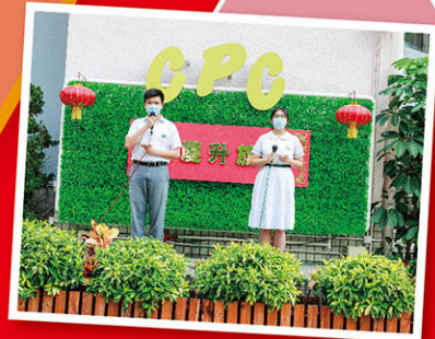
國旗下的講話分享國家成就和發展