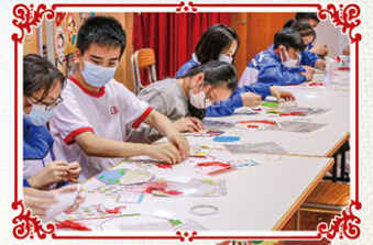
拼砌詩畫圖，研習與節日相關的詩歌。