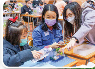
老師講解生態魚缸的原理