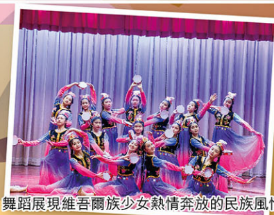
舞蹈展現維吾爾族少女熱情奔放的民族風情

《石榴花開》 同學身穿長裙顏色漸變，舞動時就是一朵朵嬌豔的石榴花。舞步和圖案編排豐富多變，需要高度的合作、默契。