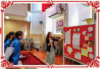
老師講解節慶的文化意義

今年中文週於11月15至18日舉行，以中國傳統節慶「尋情·識禮·一週行」為主題，將中國節慶的禮數與人情，在一週之內讓同學體驗和實踐。透過閱讀文章、觀看展板、短片和節日物品，深入了解傳統節日的習俗及文化意義，同學亦動手製作傳統節日工藝品，感受濃濃的節日氣氛。中文科特意邀請師傅現場示範如何製作啄啄糖，同學對「鑿糖」甚感興趣，最後更跟師傅學習，難得的體驗令人畢生難忘呢！