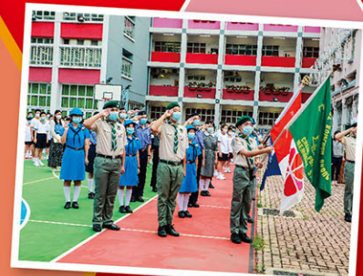
同學精神抖擻、認真專注、舉止莊重