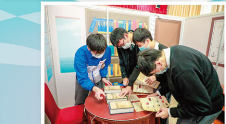
齊心合力尋找「解迷」線索