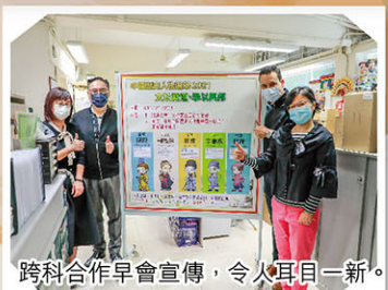
跨科合作早會宣傳，令人耳目一新。

中史科、中文科、英文科、德育、公民及國民教育組與圖書館參與國史教育中心的第四屆「年度中國歷史人物選舉」。今年主題為「文以載道，學以興邦」，同學閱讀候選人物的經世作品，觀賞短片，借閱圖書館展出主題書籍，加深對文學的認識。外籍老師和英文科主任於早會以生動有趣的形式介紹活動，並翻譯每位作家作品中的精句。同學在小息主動向中文或中史老師背誦，體會作家的高尚情操。最後，經過大家踴躍投票，年度人物選舉的結果是屈原。