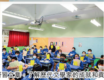
研習文章，了解歷代文學家的成就和貢獻。