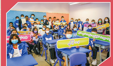
獲獎班別與校長合照