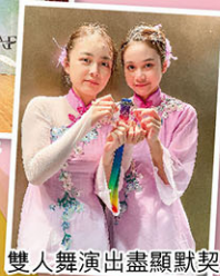
雙人舞演出盡顯默契