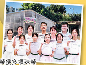
同學在全國總決賽榮獲多項殊榮