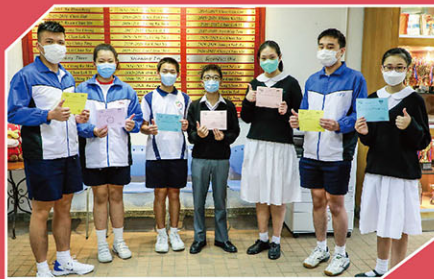
成功解開數學難題

數學週於10月19至22日舉行，老師帶動討論，同學每天做數學挑戰題，從解難中探究數學概念，提升運算和邏輯思維能力。同學踴躍參與，氣氛熱烈，合共22班平均分達標，獲得「積極參與獎」，達標同學獲得小食部現金券。是次活動趣味與知識兼備，從體驗中領略學習數學的樂趣。