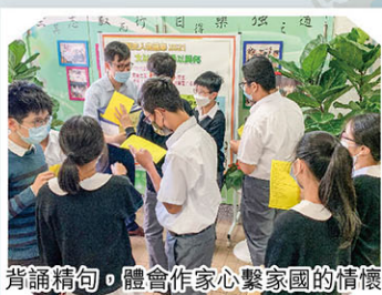
背誦精句，體會作家心繫家國的情懷。