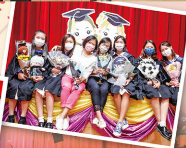
與班主任留下倩影，感恩她們鼓勵與扶持。