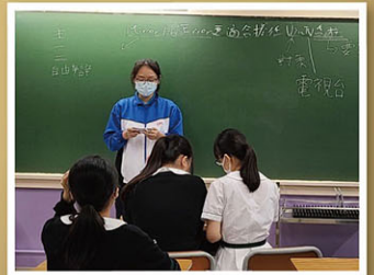
辯論練習，同學即時摘錄，商議應對。