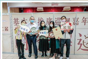
生社科、公民科、通識科老師率先體驗活動。