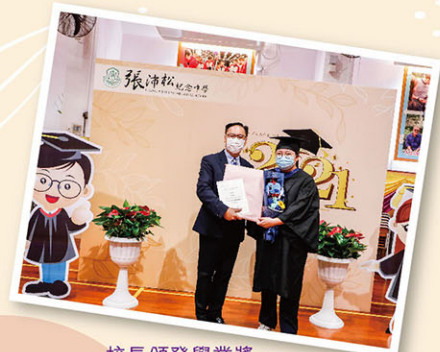
校長頒發學業獎，勉勵中六同學。

為了讓中六同學留下難忘回憶，學校邀請一眾畢業生在放榜日前留下倩影。同學穿起畢業袍都份外興奮，捧著花束和畢業公仔，跟校長、老師和家長拍照留念。同學百感交集，當中有雀躍、感激與不捨，都在不言中。