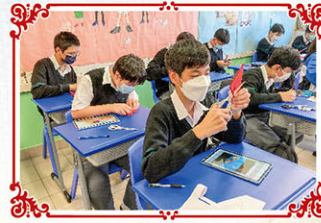
同學細心研究傳統手工藝剪紙