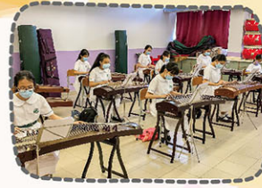
彈奏古箏認真投入