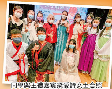
同學與主禮嘉賓梁愛詩女士合照