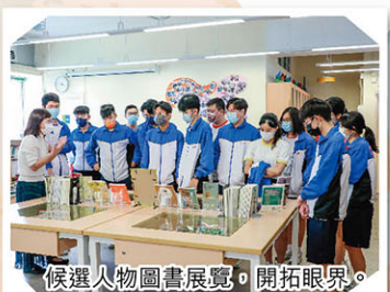
候選人物圖書展覽，開拓眼界。