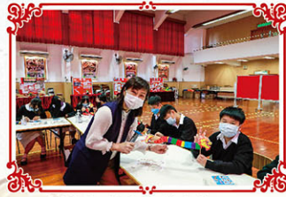
製作色彩繽紛的小龍