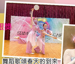
舞蹈歌頌春天的到來

《春頌》 林同學和何同學以雙人舞蹈，呈現春遊觀花，驚艷繁花盛放，桂馥蘭香的情態，隨而翩翩起舞，頌讚春臨之色。