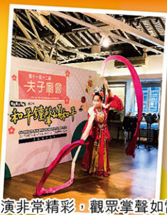
表演非常精彩，觀眾掌聲如雷