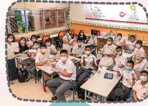
運用平板電腦進行創意藝術設計