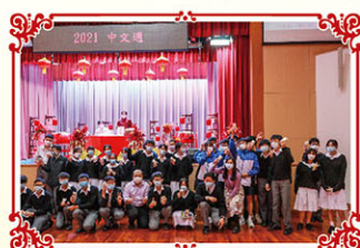
活動生動有趣，同學滿載而歸。