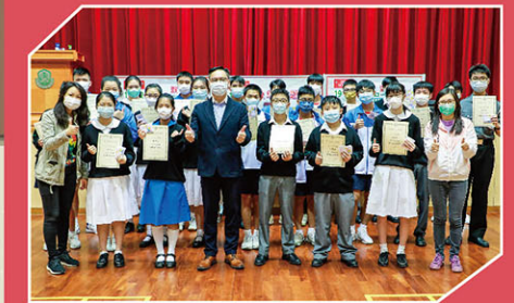
多個班別平均分達標，獲得「積極參與獎」。