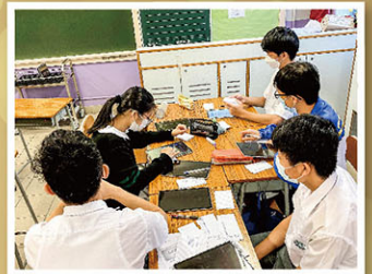
運用電子器材，蒐集資料、整理分析。