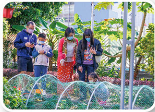
小學生及家長對有機耕種的技術甚感興趣

本校於11月27日與區內三所小學合辦親子工作坊，推動中小學STEM教育的發展，促進家校合作，強化同學綜合和應用知識能力。活動接近二百個家庭參與，反應熱烈。當天製作生態魚缸和水耕小盆栽，參觀水耕法溫室和綠庭園，認識環保生態和有機耕種的方法。大家投入活動，讚口不絕，親子同樂，歡聲笑語，共享溫馨愉快的美好時光。