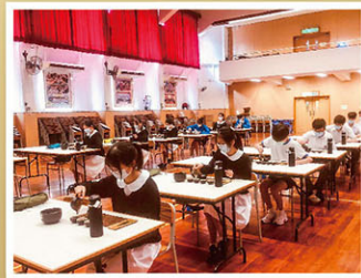
領悟茶道，體味「去凡入定」的境界。