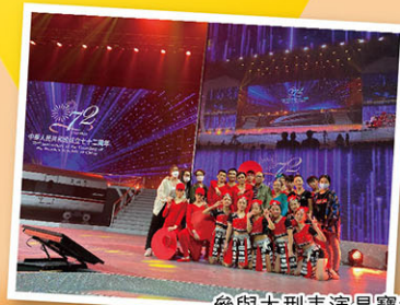
參與大型表演是寶貴的經驗