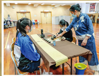
佈置茶席，實踐「借茶愛人」的精神。