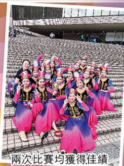
兩次比賽均獲得佳績