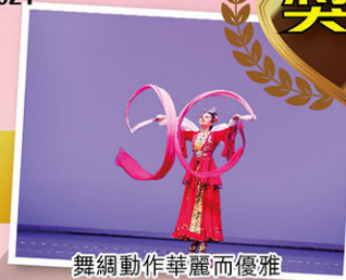
舞網動作華麗而優雅

《華燈·霓裳》 潘同學舞網技巧熟練，舞姿柔美，神形兼備，令人置身華燈初上，繁華盛世。