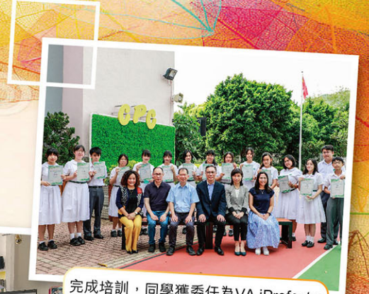
完成培訓，同學獲委任為VA iPrefect。