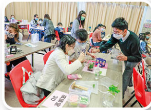
本校同學協助製作生態魚缸