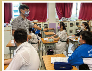
導師講授司儀技巧，同學專心上課。