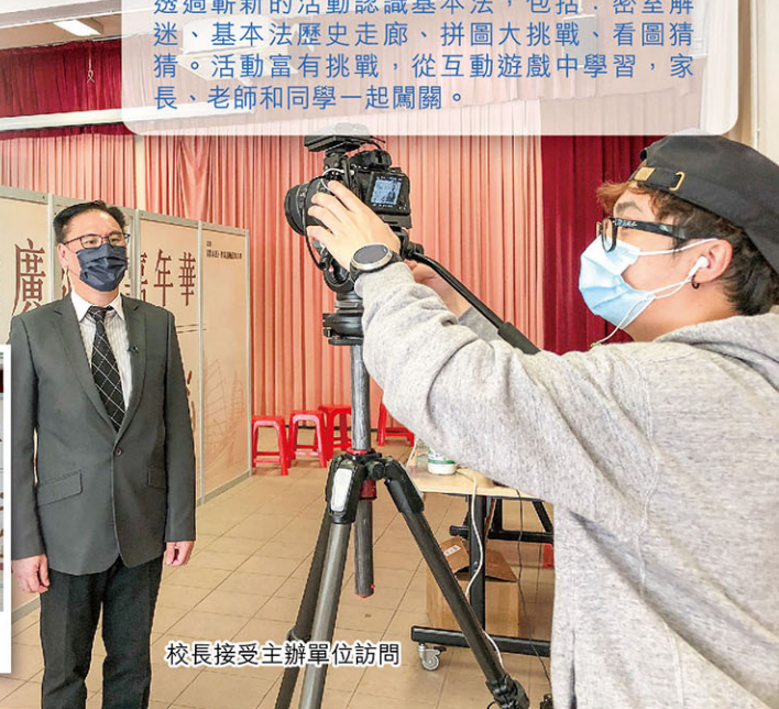
校長接受主辦單位訪問