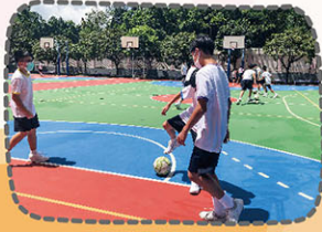
活動練習足球傳送技巧