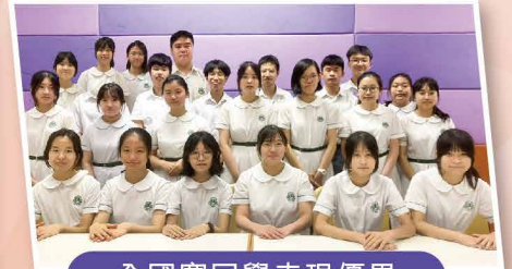
全國賽同學表現優異