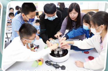
齊心合力製作環保咖啡皂