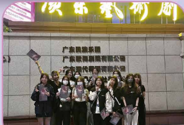
觀賞南方歌舞團大型舞劇首演【萬家燈火】