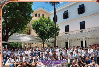
廣州荔灣博物館前合照