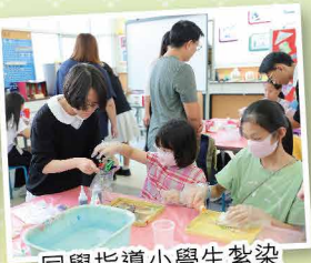
同學指導小學生紮染藝術的技巧