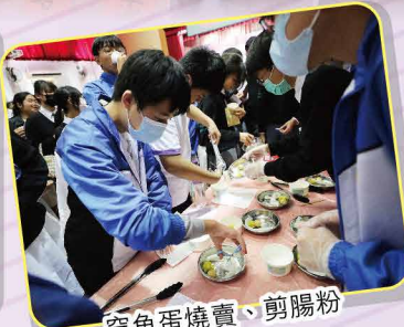
穿魚蛋燒賣、剪腸粉