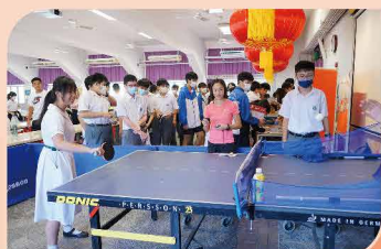
內地、香港衝金項目乒乓球大挑戰