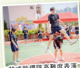
花式跳繩隊高難度表演