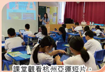
課堂觀看杭州亞運短片，加深認識