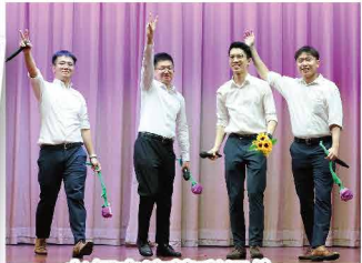
老師表演精彩絕倫，掌聲響徹禮堂