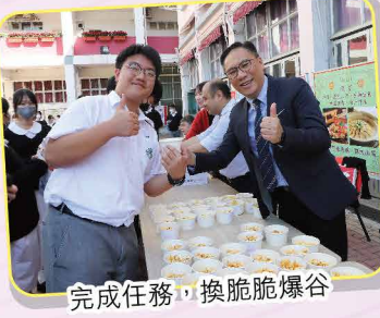
完成任務，換脆脆爆谷