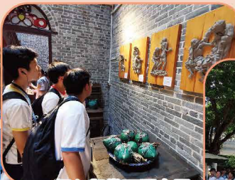
細心觀賞西關大屋獨特的建築風格