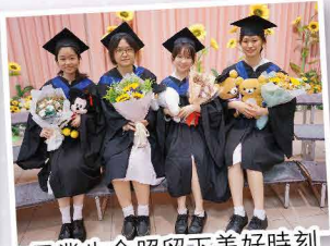
畢業生合照留下美好時刻