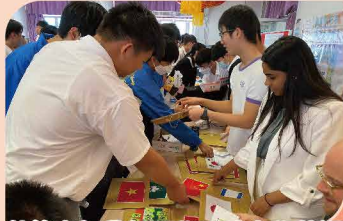
外籍老師帶領同學活動中學英語