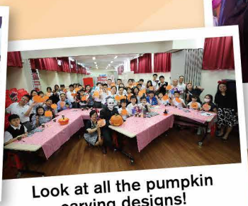
Look at all the pumpkin carving designs!