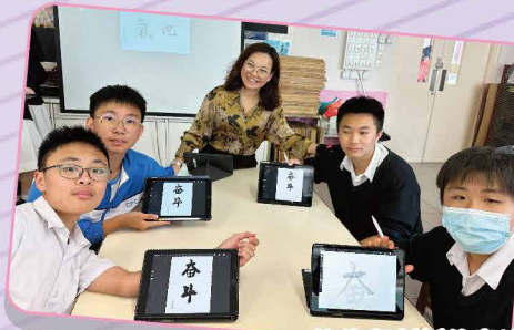
傳統與創新的書法體驗，共治一爐