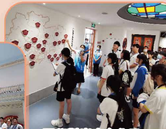
同學對嶺南文化及特色有更深入的了解