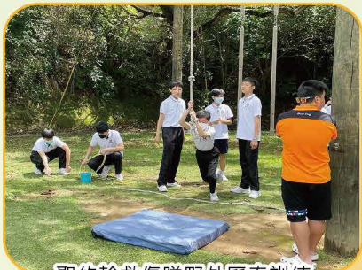
聖約翰救傷隊野外歷奇訓練