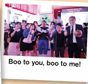
Boo to you, boo to me!