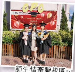
師生情牽繫校園，感激沿路陪伴