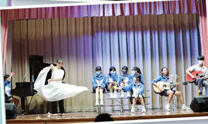
演唱揉合樂器伴奏和舞蹈，表演多元化

比賽分為社際和班際兩個項目，各隊表現十分投入，同學各顯其才、施展渾身解數，運用不同的多元藝術和無限的創意，演唱參賽歌曲，透過音樂帶動現場氣氛，獻上一場精彩的表演。台下老師、同學落力為參賽者打氣，歡呼聲、掌聲不絕於耳，現場氣氛熱鬧。最後，由老師演唱多首流行金曲，展現音樂才華，為活動寫下完美的句號。