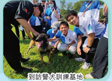
到訪警犬訓練基地