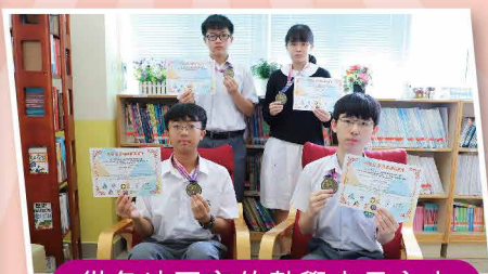
從各地國家的數學尖子之中脫穎而出