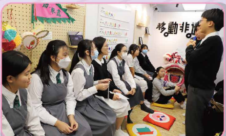
非遺專車小館長培訓