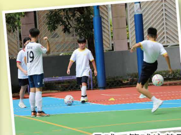
足球、籃球培養團隊合作精神