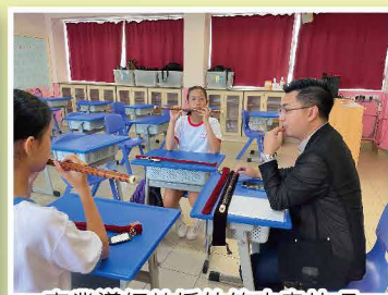
專業導師教授竹笛吹奏技巧