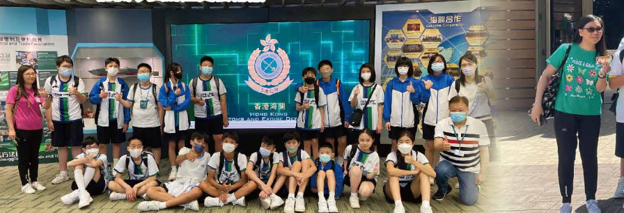
少年警訊參觀海關大樓，認識海關的日常工作