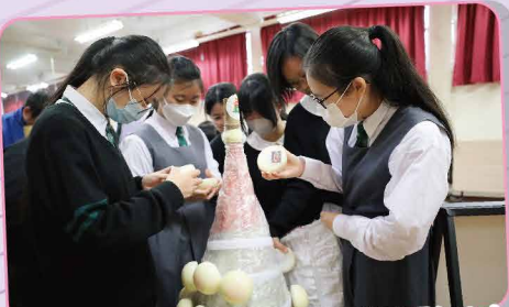
同心協力砌出長洲太平清醮的小型「包山」