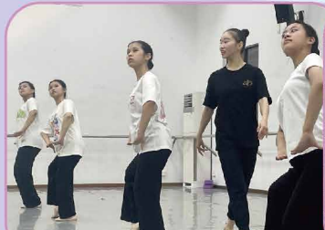
參加專業舞蹈學習課