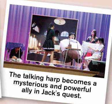
The talking harp becomes a mysterious and powerful ally in Jack's quest.