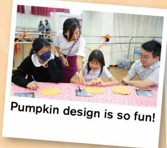
Pumpkin design is so fun!