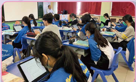
投選心目中的年度中國歷史人物