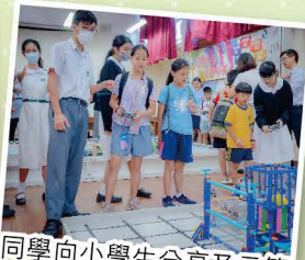
同學向小學生分享及示範 Vex IQ 機械人比賽