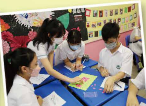
分組討論，課堂參與度高