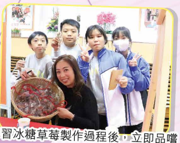
學習冰糖草莓製作過程後，立即品嚐