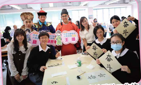
同學化身候選人參與午間書法體驗工作坊