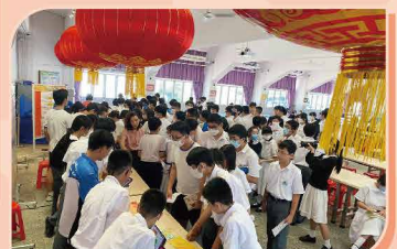
午間攤位人山人海