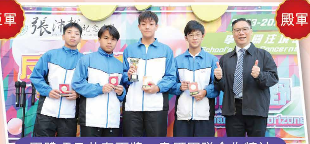
團體項目共奪兩獎，盡顯團隊合作精神