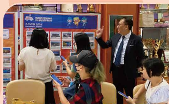
家長齊參與「杭州亞運暨國民知識網上問答遊戲」