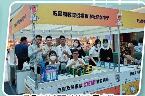
展示本校STEAM的教育成果