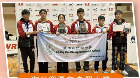
海外賽勇奪多個大獎

4815B隊 Tournament Champions (聯隊冠軍) Robot Skills 2nd Place (技能賽亞軍)