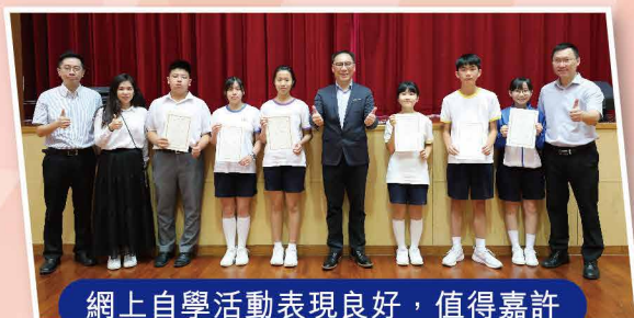
網上自學活動表現良好，值得嘉許