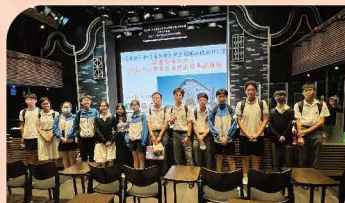
基本法校園大使參加國慶特備活動：戲曲中心導賞及茶館劇場粵劇體驗