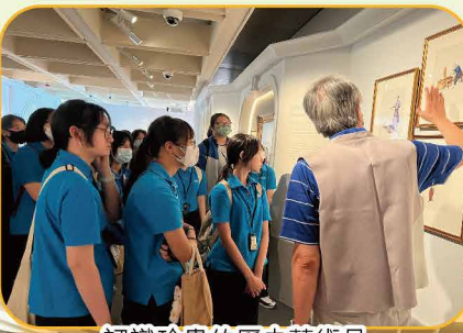
認識珍貴的歷史藝術品