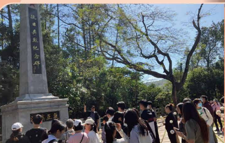
「網上問答遊戲」勝出同學及家長獲選到沙頭角禁區之旅