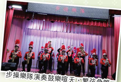
步操樂隊演奏鼓樂喧天、繁弦急管