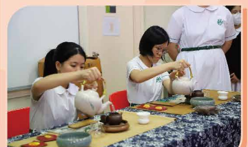
從品茶認識中國文化