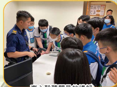
專心聆聽關員的講解