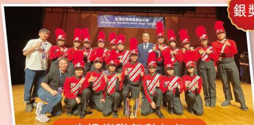
步操樂隊氣勢如虹