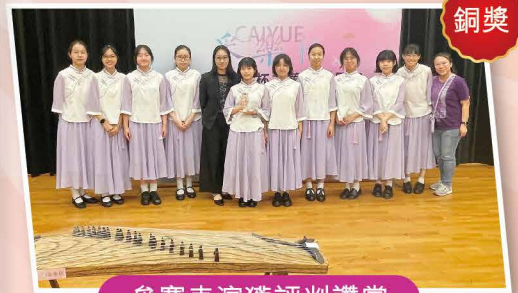
參賽表演獲評判讚賞