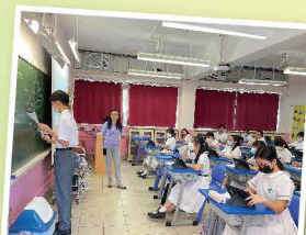
互動式教學，促進師生交流