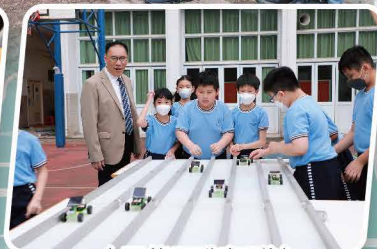
太陽能電動車測試