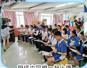
與坪中同學一起上課