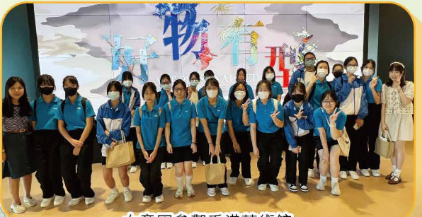
女童軍參觀香港藝術館