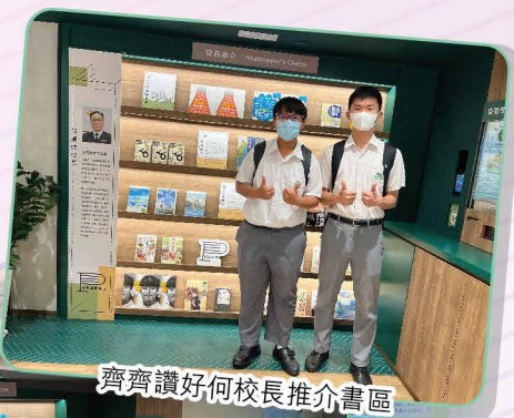
齊齊讚好何校長推介書區