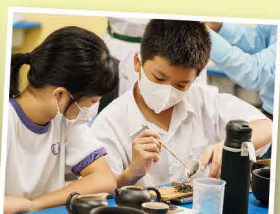
賞茶、品茶陶冶性情