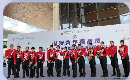
在港珠澳大橋送客平台表演