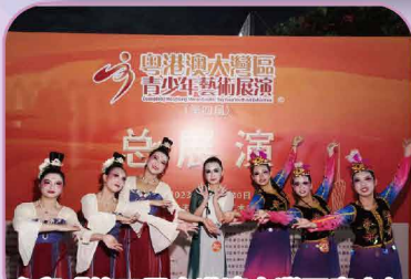
參與「第四屆粵港澳大灣區青少年藝術展演總展演-中國香港(舞蹈)賽區晉級邀請賽」