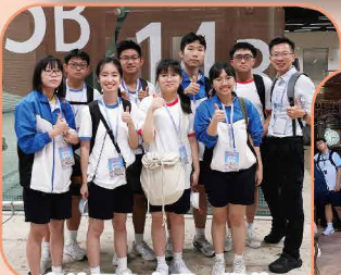
車站開心合照，期待考察活動