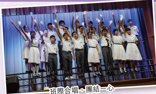
班際合唱，團結一心