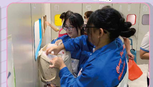
回收活動，身體力行實踐綠色生活