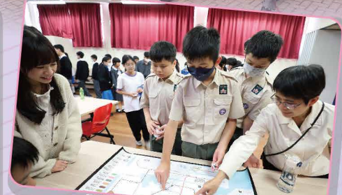
從遊戲認識全港鐵路網