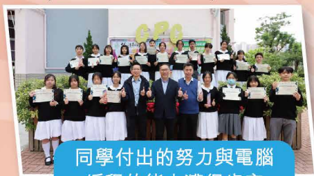
同學付出的努力與電腦編程的能力獲得肯定

Excellence Award(卓越獎) Robot Skills Champion (機械人技能賽冠軍)