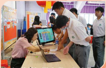
通過遊戲認識大灣區經濟狀況