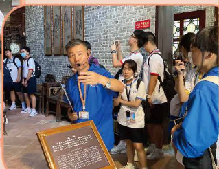
同學認真聽導遊講解西關大屋的歷史