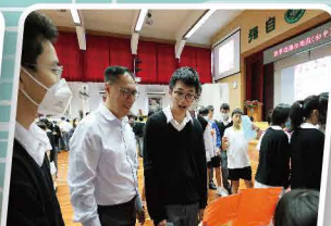
校長指導同學思考奇偶次方數學題