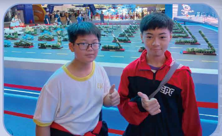
參觀珠海太空中心