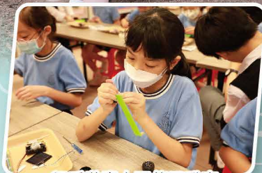
親手裝嵌太陽能電動車