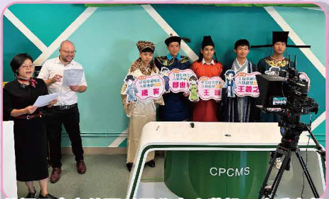
英語早會宣傳配以同學古人裝扮，生動有趣