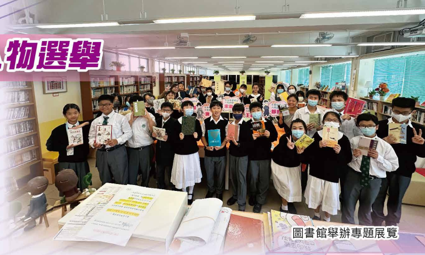
圖書館舉辦專題展覽

今年主題為「怡情審美·永續動能」，介紹歷代藝術成就非凡的著名歷史人物。早會時段以英文介紹歷史候選人，並閱讀相關的文章；德公網站提供歷史人物資訊及網上投票；圖書館舉辦專題展覽；午膳設有書法、水墨畫體驗工作坊；課後舉辦書法家訪談會。活動多姿多采，能多方面讓同學深入認識歷代藝術家。