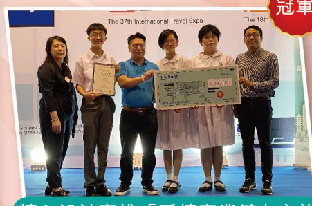
精心設計高雄「愛情產業鏈」之旅，榮獲冠軍及現金獎5000元