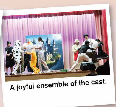
A joyful ensemble of the cast.