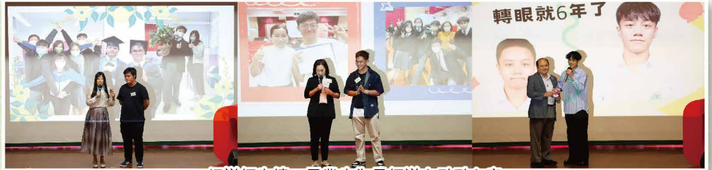
細說師生情，畢業生為恩師送上點點心意