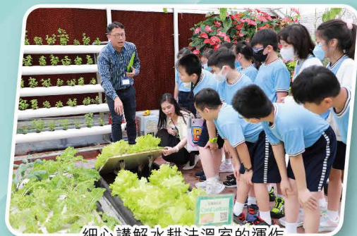
細心講解水耕法溫室的運作