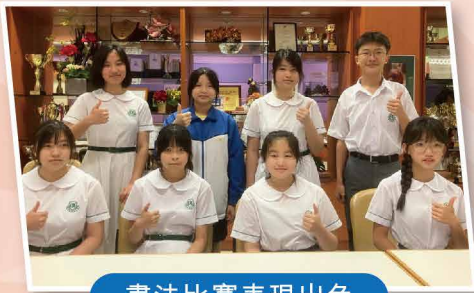
書法比賽表現出色