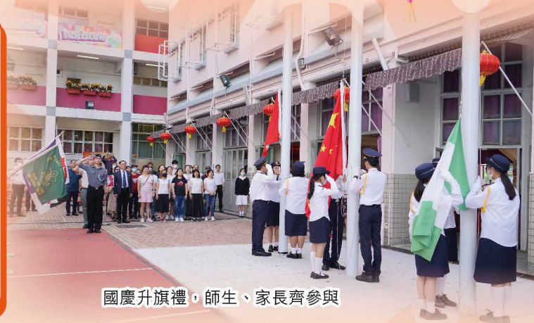
國慶升旗禮，師生、家長齊參與

適逢第19屆亞運會於9月在中國杭州舉行，本校因勢利導，以杭州亞運做主軸，透過電腦互動遊戲、攤位遊戲、國民教育展覽、國慶升旗禮及各科課程配合，以有機結合，多重進路，軟著陸推動國民教育，增進同學對現今國情發展及中國體育運動的認識，師生和家長全民參與，有助增強文化自信和培養國民身份認同。活動非常成功，場面熱鬧。本校更將此活動參加教育局舉辦的「杭州亞運會校本活動比賽」，最後榮獲「最佳表現獎」，可見活動獲得教育局的肯定，令人鼓舞。