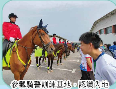
參觀騎警訓練基地，認識內地警務訓練工作