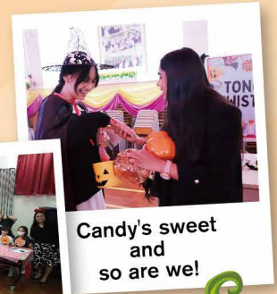
Candy's sweet and so are we!