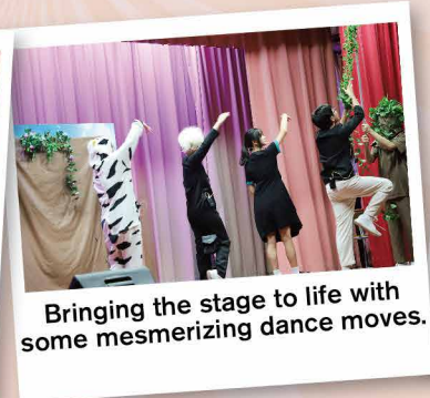
Bringing the stage to life with some mesmerizing dance moves.