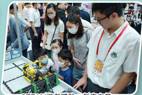
STEAM遊戲體驗，新奇有趣