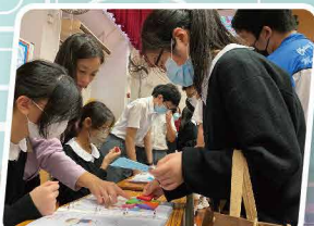
百變七巧板訓練幾何觸覺