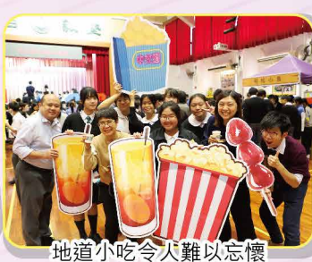
地道小吃令人難以忘懷