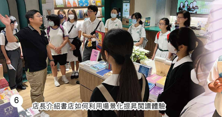
店長介紹書店如何利用場景化提昇閱讀體驗