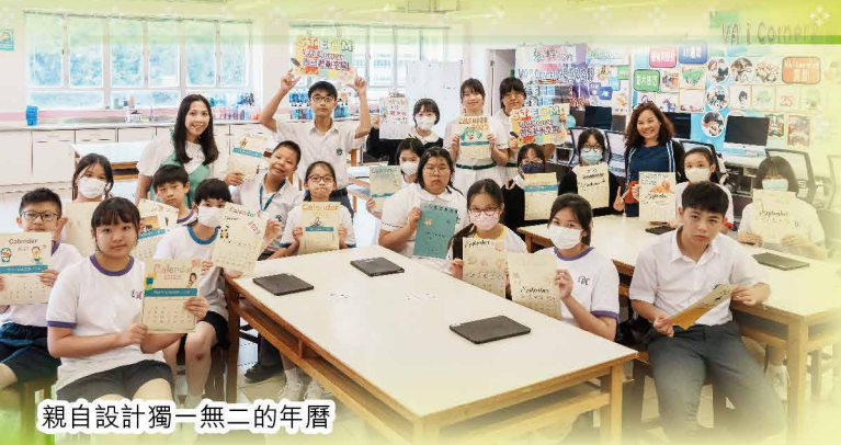
親自設計獨一無二的年曆

為了讓中一新生認識學校環境及適應校園生活，本校特為同學準備「中一迎新週」，迎新週學術與活動兩者兼備。學術方面，中、英、數課堂，以互動式教學，幫助同學溫故知新，裝備自己，輕鬆銜接中學新課程。活動方面，老師安排十多項精彩的課外活動體驗，同學按照自己的興趣選擇，一起投入中學多姿多采的校園生活。