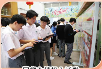
同學全情投入活動