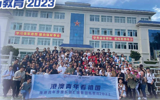
團員於珠海警備區「鋼八連」大合照