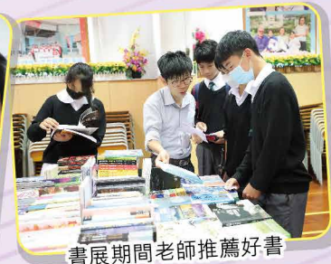
書展期間老師推薦好書