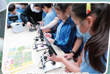
顯微鏡下的花瓣結構