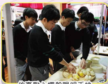
仿真點心擺盤眼明手快