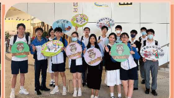
活動榮獲教育局頒發的「最佳表現獎」