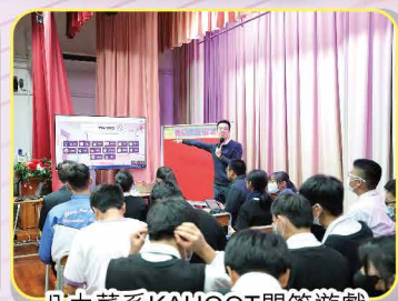
八大菜系KAHOOT問答遊戲