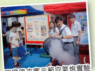
同學跟來賓示範空氣炮實驗