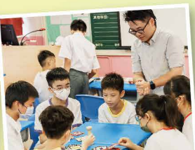
桌上遊戲訓練思維