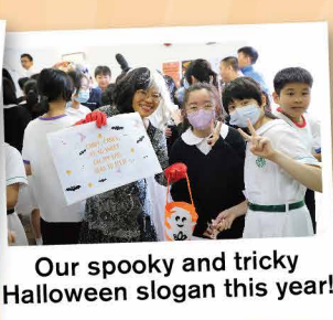
Our spooky and tricky Halloween slogan this year!