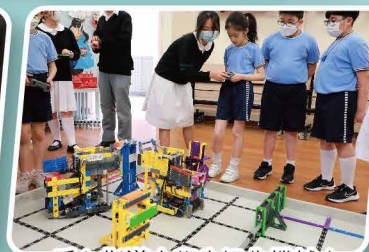
悉心指導小學生操作機械人