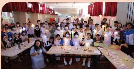
老師與中一同學品嘗傳統月餅，製作中秋花燈