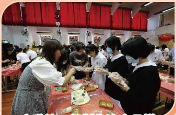
中秋節一起製作冰皮月餅