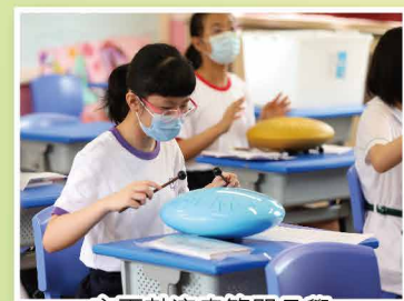
忘憂鼓演奏簡單易學