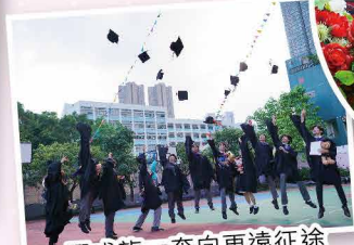
一躍成龍，奔向更遠征途