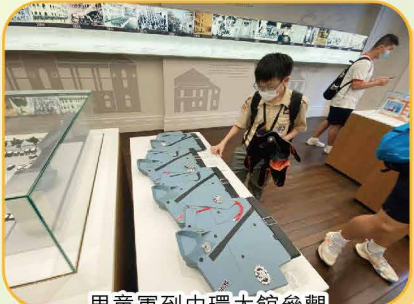
男童軍到中環大館參觀