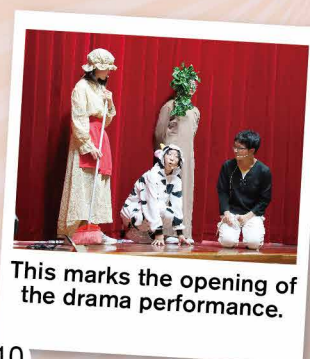
This marks the opening of the drama performance.

We are delighted to announce the triumphant return of the English Drama Club with their captivating performance of "Jack and the Beanstalk." This marks their first performance since the 2018 COVID-19 pandemic, making it an incredibly special occasion. Our talented actors, with their exceptional skills and dedication, enthralled the audience, transporting them into the enchanting world of the story. The morning was filled with excitement, laughter, and awe-inspiring moments that will be remembered for years to come. Congratulations to all the members of the English Drama Club for their outstanding efforts and for delivering a truly remarkable show. Your hard work and passion have undoubtedly paid off, leaving the audience in awe and admiration.