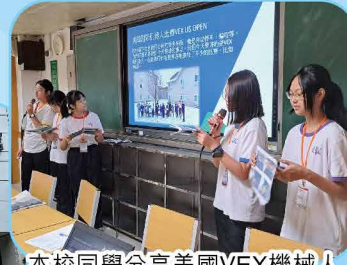
本校同學分享美國VEX機械人比賽經驗