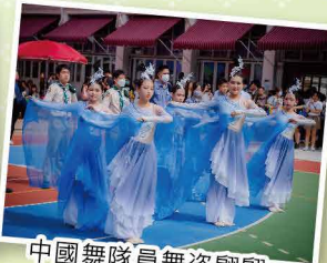
中國舞隊員舞姿翩翩