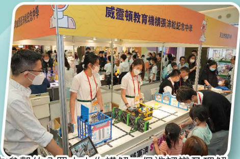
為參觀的公眾人士作講解，促進認識及理解

活動由西貢及將軍澳中學校長會主辦，西貢區撲滅罪行委員會、將軍澳警區及西貢區家長教師會聯會協辦，西貢民政事務處協辦及贊助。當日的攤位，展示本校STEAM教育的方向和成果，透過不同的活動和比賽，建立同學的探索思維及正向價值觀，培育科技人才。