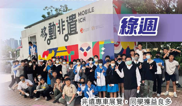
非遺專車展覽，同學獲益良多

活動以「可持續發展」為主題，中文、生物和人文學科在課堂帶領同學思考討論天人合一、文化遺產、生態旅遊及綠色經濟的課題，讓同學把相關概念和知識整合，融會貫通。非遺專車亦駛進校園，把不同非物質文化遺產（非遺）項目帶到各位師生身旁。非遺專車內設有展覽及互動設施，同時配有一系列教育活動，例如：非遺專車小館長、非遺圖書展覽、文化遺產傳承手作坊、攤位遊戲等，以有趣和互動的方式提升同學對非遺的認識，從中學習欣賞和珍惜文化遺產。