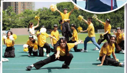
啦啦隊表現帶動全場氣氛